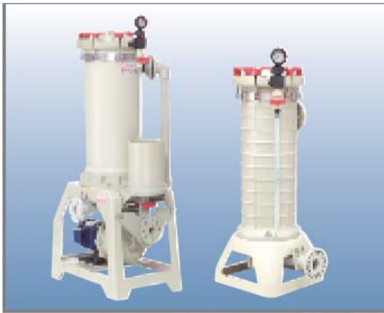
袋濾式設計 FILTER BAG TYPE