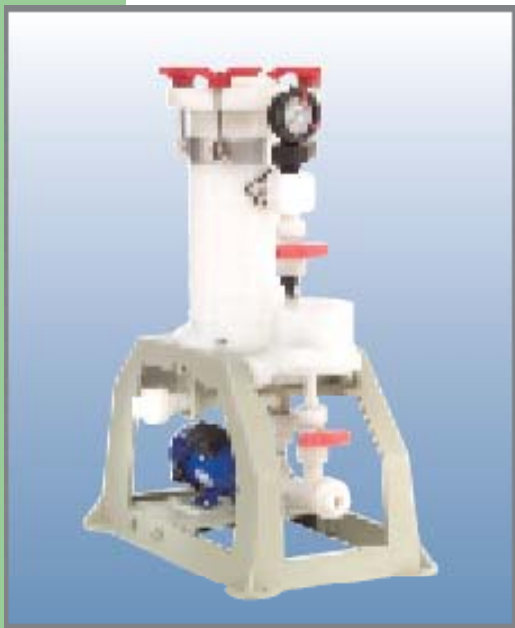
特殊材質 MATERIAL PVDF