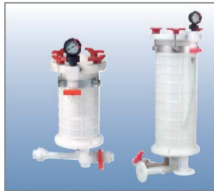
特殊材質 MATERIAL PVDF