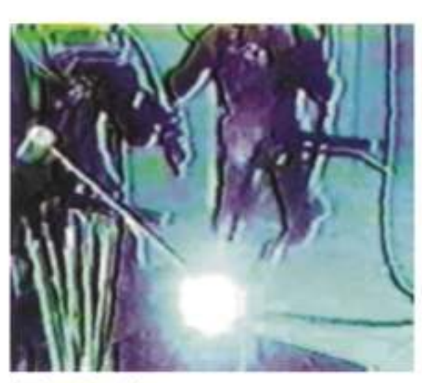
Under water weldomg 水中溶接