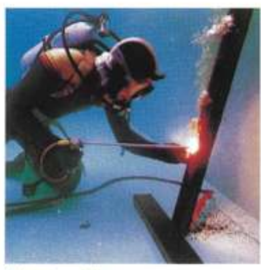
Under water cutting 水中切断