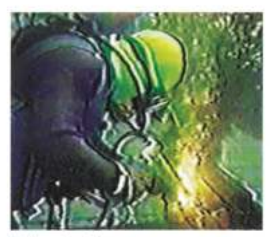
Under water cutting 水中切断

The type of "SC9-5W" and "SC8-5W", "W-7" may realize the high efficient and economical under-water cutting in the age of sea-development even for automatic equipments.