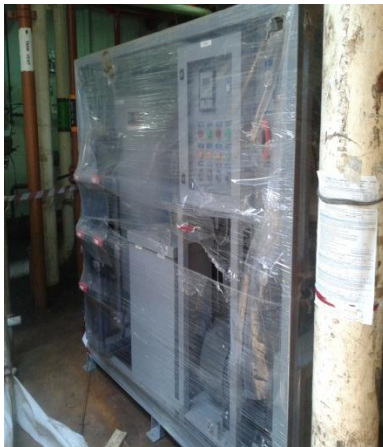
SWRO 100 T/Day