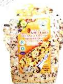
有机日本BB粥 Organic Unpolish BB Porridge