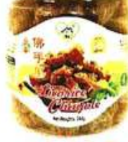
甘草佛手果 Licorice Chayote