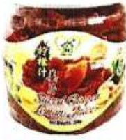
柠檬汁姜片 Sliced Ginger Lemon Juice