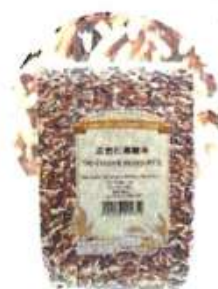
三色红黑糙米 Tri-Colour Mixed Rice