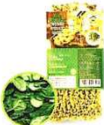
有机菠菜拉面 Organic Spinach Ramen