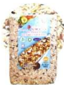
保健十谷米 Superior Ten Multi Grains