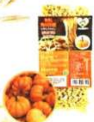
有机南瓜拉面 Organic Pumpkin Ramen