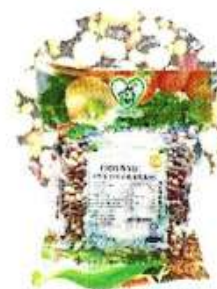
有机高能量五色豆 Organic Five Colour Bean