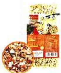
有机养生十谷拉面 Organic Ten Grains Ramen