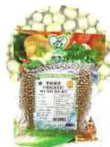
有机绿豆 Organic Mung Bean