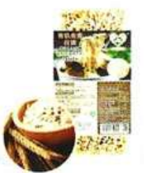
有机全麦拉面 Organic Wholemeal Ramen