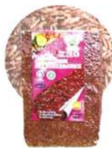
红糙米 Red Brown Rice