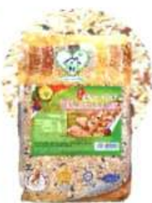
养生十谷米 Ten Multi Grains