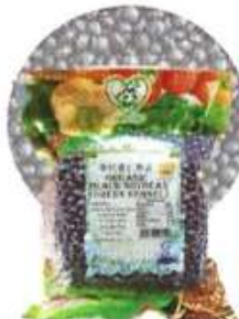
有机青仁黑豆 Organic Black Soybean (Green Kernel)