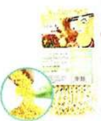
有机小米拉面 Organic Millet Ramen