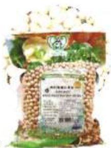
有机高蛋白黄豆 Organic High Protein Soy Bean