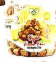
八宝果 Eight Treasure Fruits