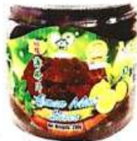
柠檬薄荷片 Lemon Mint Slice