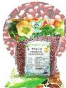
有机红小豆 Organic Adzuki Bean