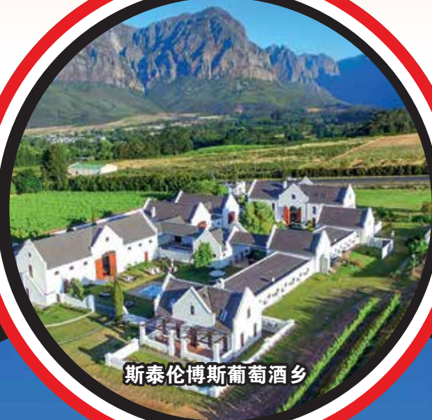
斯泰伦博斯葡萄酒乡