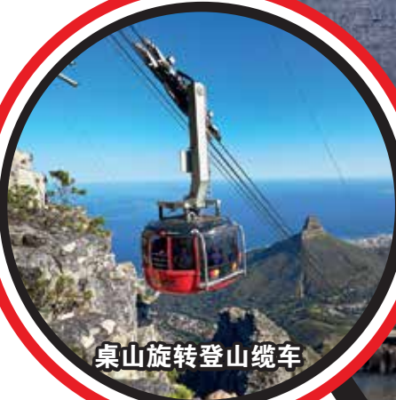
桌山旋转登山缆车