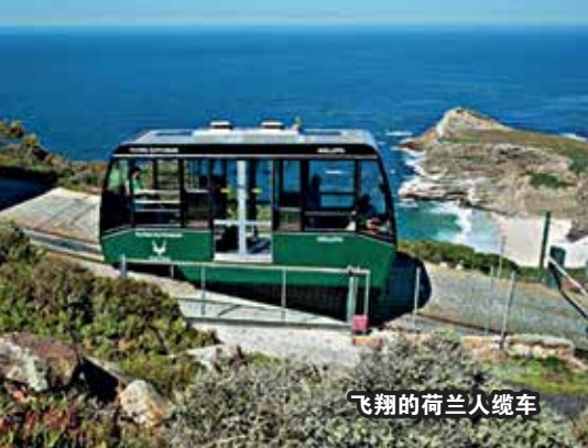
飞翔的荷兰人缆车