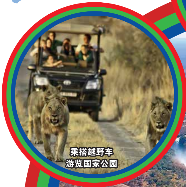
乘搭越野车 游览国家公园