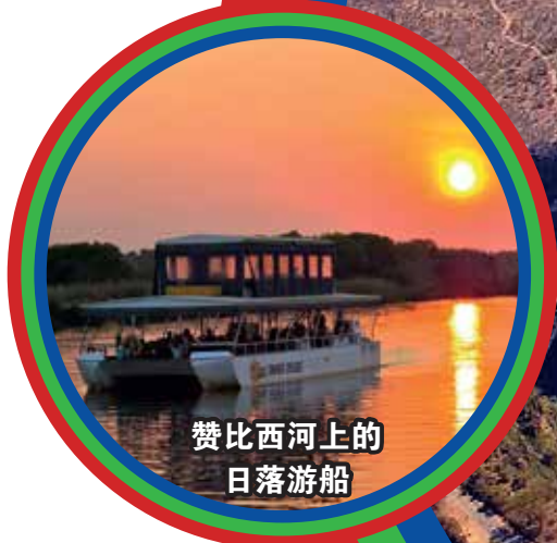
赞比西河上的 日落游船