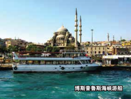
博斯普鲁斯海峡游船