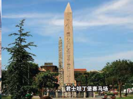
君士坦丁堡竞技场