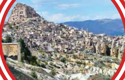
乌奇西萨尔城堡村