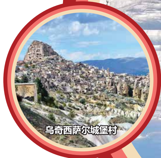
乌奇西萨尔城堡村