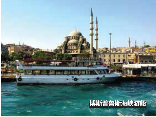
博斯普鲁斯海峡游船