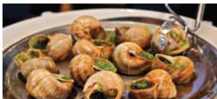
3道菜-巴黎-法國蝸牛