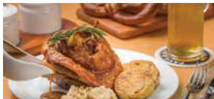
3道菜-滴滴湖-德国烤猪脚