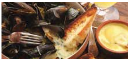
3道菜-布鲁塞尔-青口贝