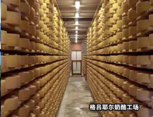
格吕耶尔奶酪工场