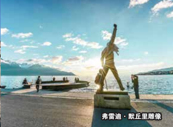
弗雷迪·默丘里雕像