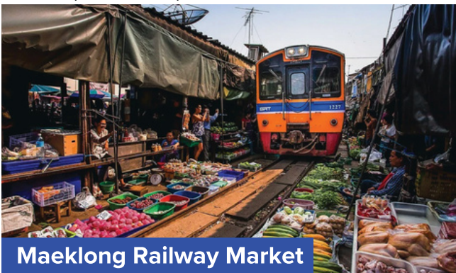
Maeklong Railway Market