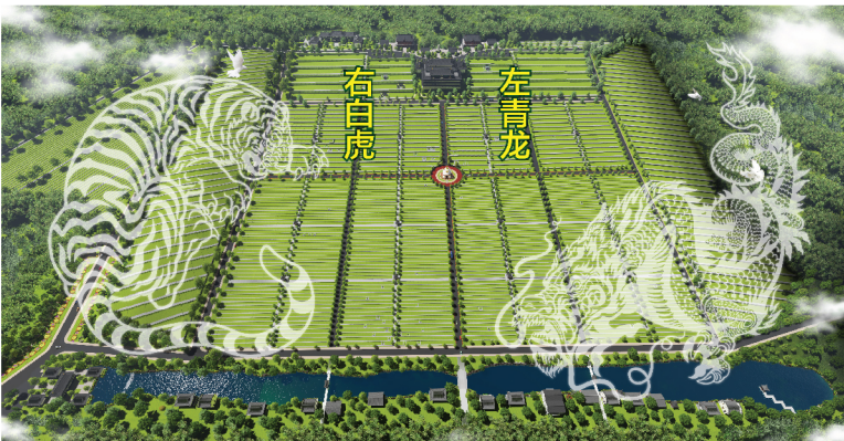
●山莊左右得龍虎山脈護持，是難得一見的風水寶地